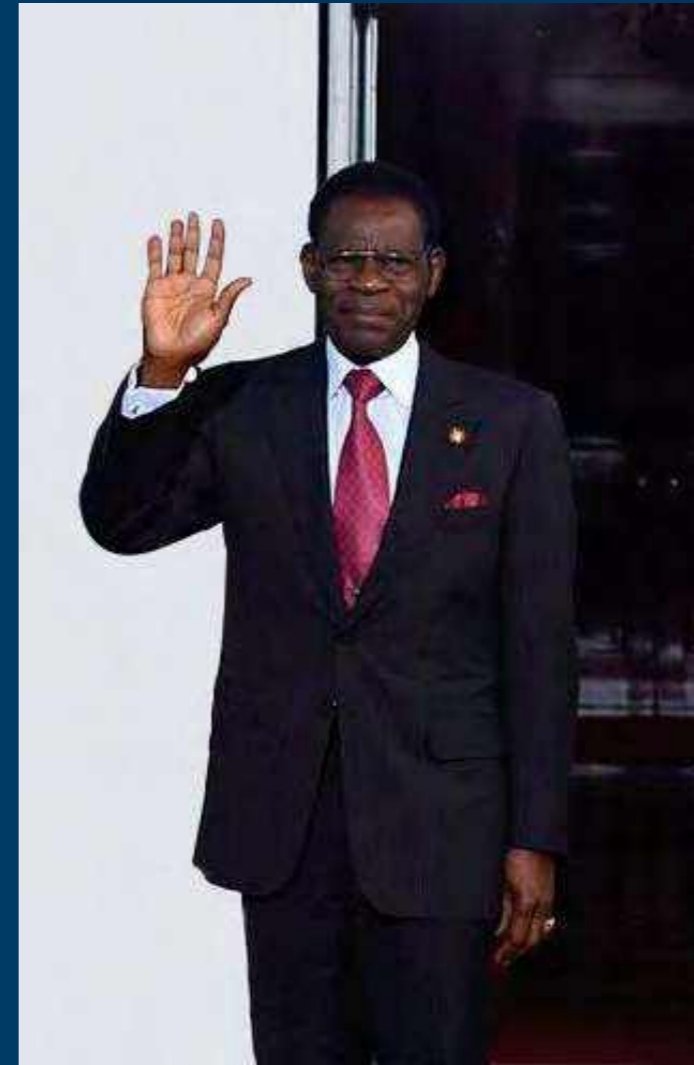
— S.E Teodoro Obiang Nguema — Presidente de la República Impulsor del desarrollo de Guinea Ecuatorial